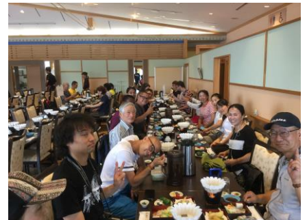
昼食(鬼ヶ城センター)